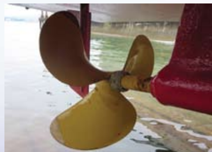
運送船／広島県 付着物無し、成績良好