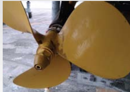
プレジャー艇／夢の島(約4ヶ月実績) プロペラ・シャフトとも付着物・汚損無し、成績良好

プライマーの付着性が向上したことにより、プロペラを磨く下地処理作業が軽減されます。