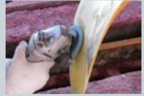
プロペラ表面の目粗し

羽根の先端は水流摩擦と遠心力で剥がれる恐れがあるため、マスキングして予め塗り残すことを推奨します。