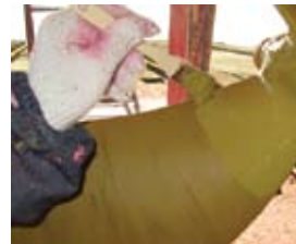
フィニッシュ塗装