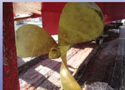
漁船／広島県 付着物無し、成績良好